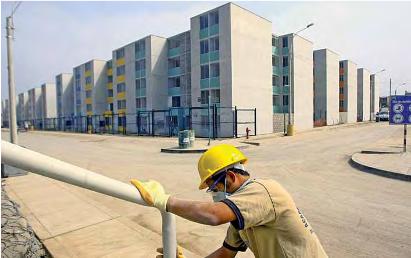
Construcción de edificaciones residenciales (Fuente: http://noticiasnorte.com/2010/02 ).

de obras de ingeniería y edificaciones y que han reducido de manera significativa el déficit cuantitativo. Desde agosto del año 2006 a la fecha se han promovido 232715 viviendas a nivel nacional; se ejecutaron 2 215 proyectos de agua y saneamiento y se entregaron 792575 títulos de propiedad. (Fuente: MVCS-OGEI-Unidad Estadística).