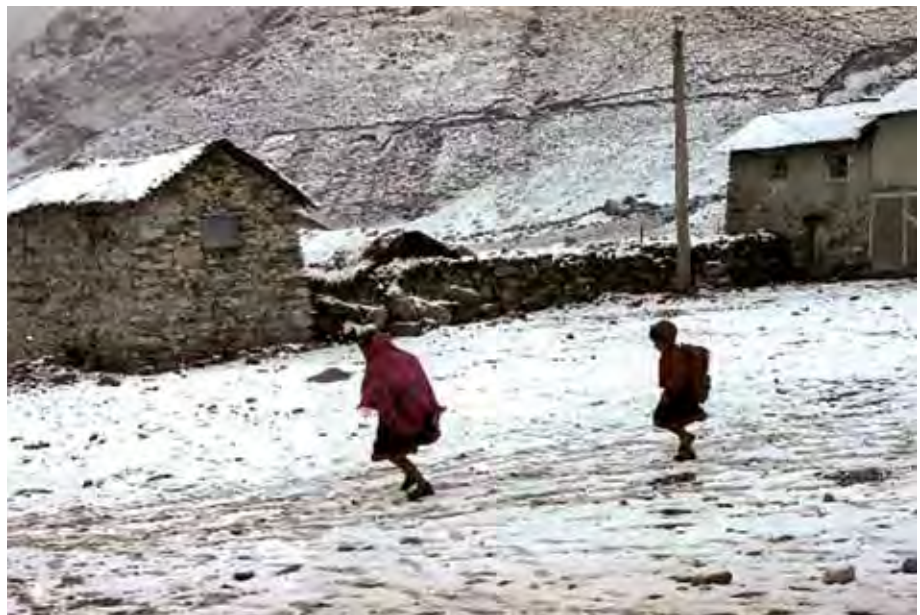
Friaje en la sierra peruana (Fuente: http://www.elperuano.pe/Edicion/noticia.aspx?key=DD81PFT/7w0= ).

Si bien es importante resaltar este crecimiento, es prioridad para el Ministerio de Vivienda, Construcción y Saneamiento que las edificaciones cuenten con las condiciones y estándares de calidad. Para ello, la Dirección Nacional de Construcción como órgano de línea del viceministerio de Construcción y Saneamiento propone lineamientos de política, normas y procedimientos referidos a la construcción de infraestructura, promueve el desarrollo, evalúa su aplicación y estimula la iniciativa privada a fin de mejorar la calidad de vida de la población.